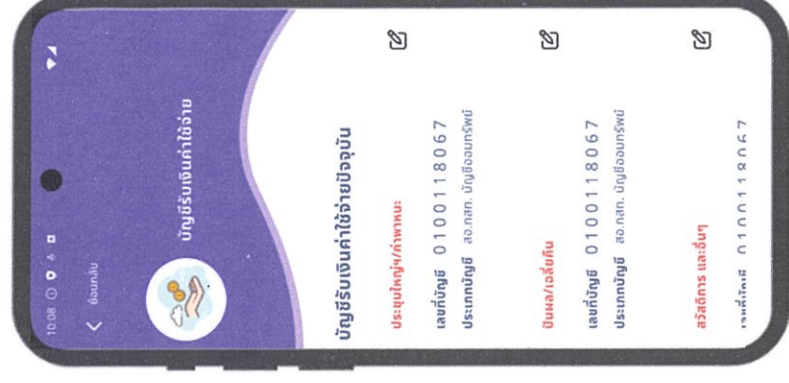
3. เข้าเมนูมุมขวาของ “ประชุมใหญ่/ค่าพิกัด”