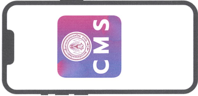
1.เข้าสู่ระบบแอปพลิเคชัน CMS