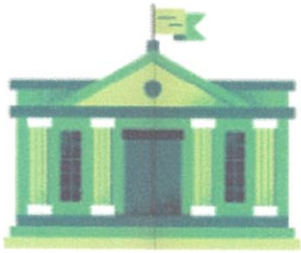
ศาลปกครอง