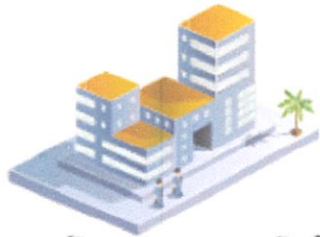
กองบัญชาการ กองทัพอไทย